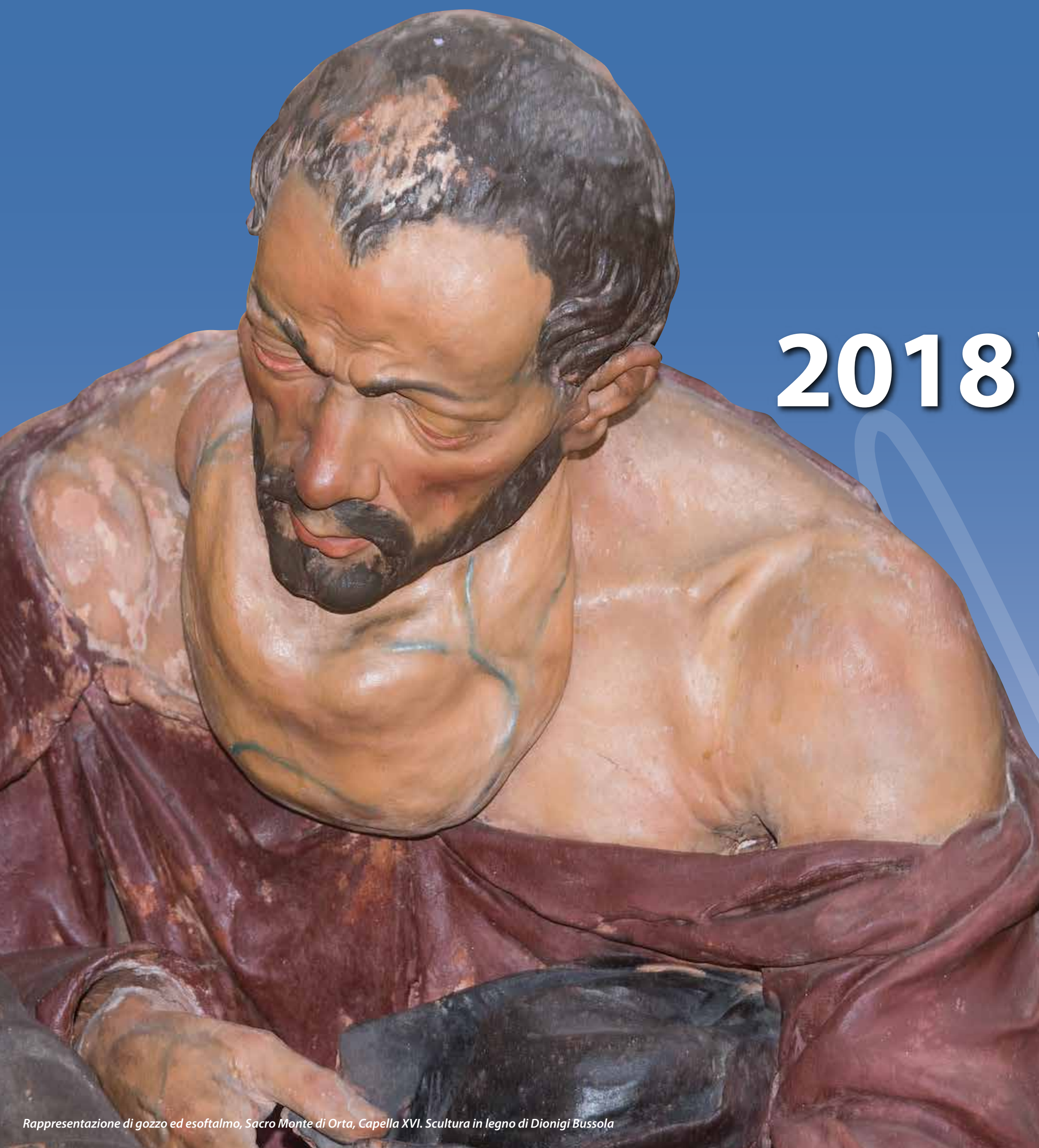
Rappresentazione di gozzo ed esofalmo, Sacro Monte di Orta, Capella XVI. Scultura in legno di Dionigi Bussola